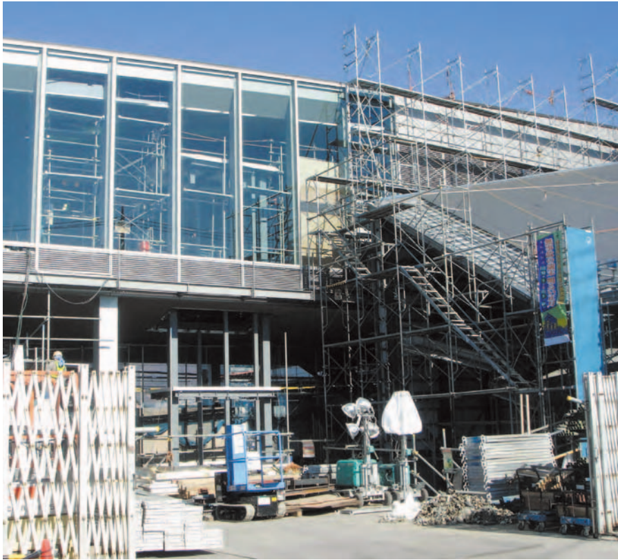
供用開始が待たれる竜王駅舎