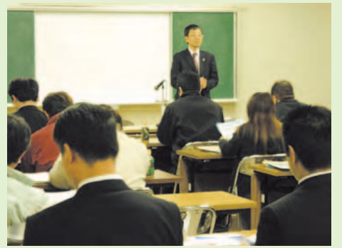
融資保証の説明をする信用保証協会職員： 商工会本所12月6日(木)

商工会員の為の知って得する「金融制度」説明会開催。商工会と管内四金融機関の金融制度案内並びに信用保証協会の「責任共有制度」・県商業振興金融課による県制度融資の説明会を行いました。今後も、管内四金融機関との連携を強化して、会員事業所経営発展の支援をはかります。