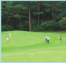
グリーン上でプレー する会員