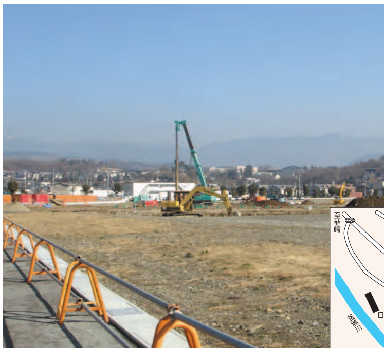
(仮称)ラザウオーク甲斐双葉建設地