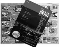
甲斐市逸品商カタログ Vol.12

消費者からは、「知らなかった店が紹介されている」、「店舗内に入りづらい店だったが、品物やメニューの金額が紹介されているので、今度は入店してみたい」などの声が寄せられた。