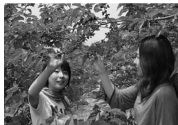
▲ 桑の実観光ツアー