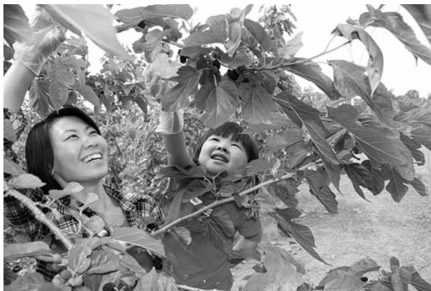
桑の実を摘む観光ツアー

商工会では十年前から地域おこしの一環として、桑の実ジャムを製造販売し、六年前からは桑の実観光ツアー(甲斐市大笠地内)を実施している。本年度は、六月五日から十四日迄開催し、テレビ放映(旅サラダ)等により、大勢の観光客で賑わった。又、市当局の理解を得て、来年度の桑の実観光ツアーに向け、桑園の整備を実施しており、観光客を迎える準備を整えているところで、来年度のツアーの期間は、平成二十二年六月四日(金)から六月十二日(日)までである。