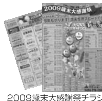
2009歳末大感謝祭チラシ

市内全域で共通の売出しを確保することで、消費者に地元商店の利用を促し固定客の確保に結びつけることを目的として、商工会員である小売店、飲食店、サービス店など六十四店舗が参加した。